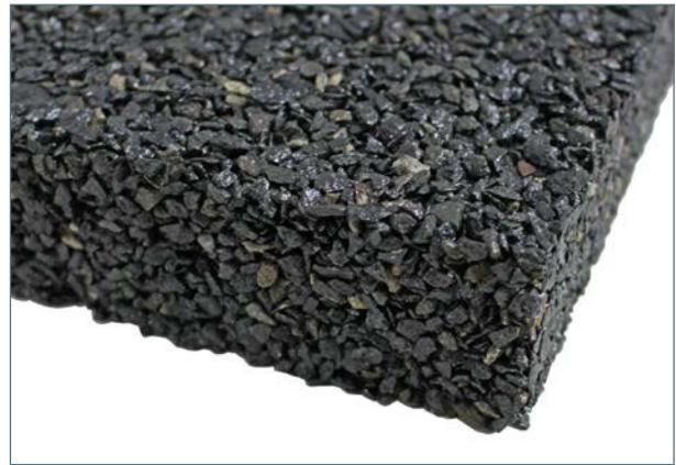
Das Materialgemisch verbindet sich zu einem festen Bauteil mit hoher innerer Dämpfung.

ANLEITUNG ZUR INSTALLATION MITHILFE EINER ESTRICHPUMPE DER FIRMA PUTZMEISTER IST AUF ANFRAGE ERHÄLTlich.