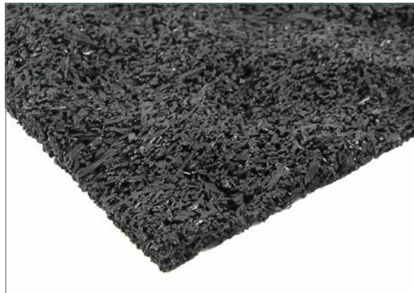
Regupol® sound 47, profilierte Unterseite